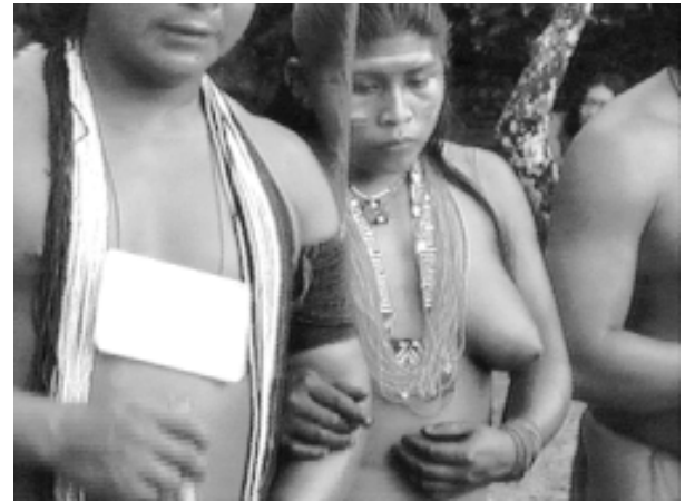
Figure 2 Danse yawalunā (détail).