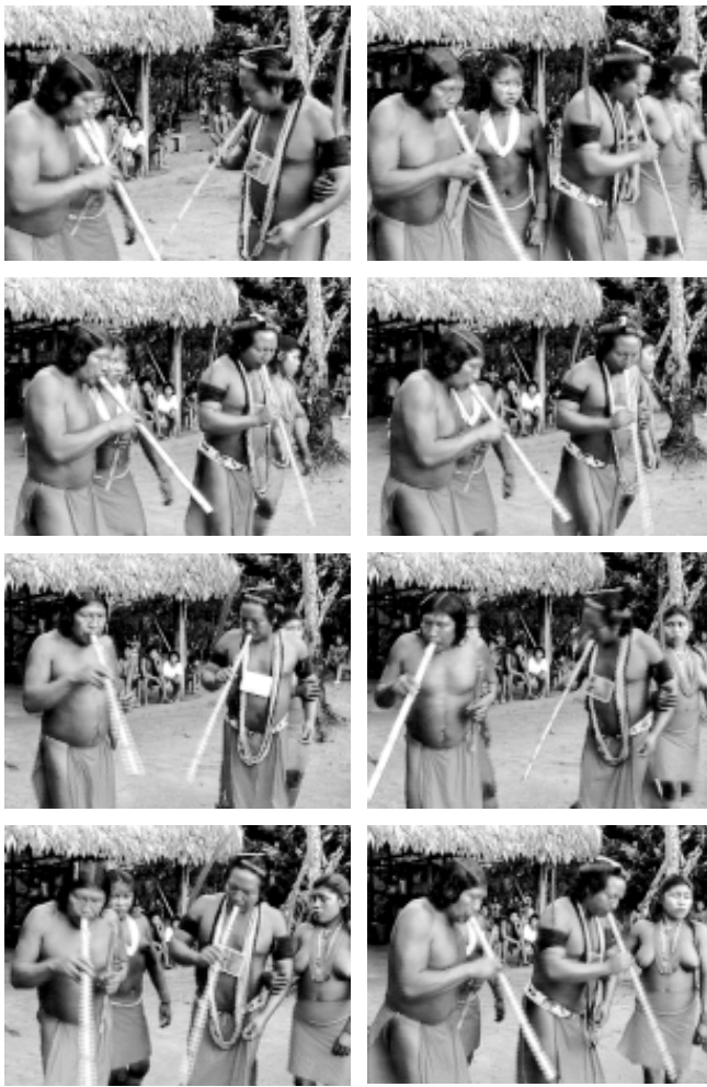
Figure 4 Fin de séquence instrumentale.

tours-pivots successifs sont nommés oylowalowa , « ils se tournent et se retournent » ( -lowa « tourner la face vers », vient de la racine -owa , « visage »). Les tours-pivots sur place sont réalisés à différents moments de chaque séquence, mais ils y occupent systématiquement une position syntaxique clé : ils ouvrent et ferment les séquences instrumentales, en constituent les formules introductives et conclusives. En début de séquence instrumentale, les tours-pivots sont moins nombreux et plus brefs : environ six retournements sur deux pas. Les tours-pivots s'effectuent selon un angle de 90° à 140° : ce ne sont pas, en général, des demi-voltes complètes, mais cet angle est suffisant pour exprimer le retournement, le changement d'orientation sur place.