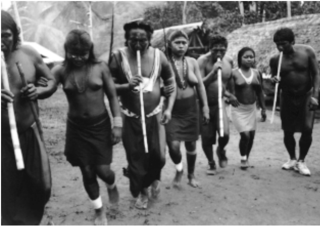
Figure 1 Danse yawalunā , 1995.