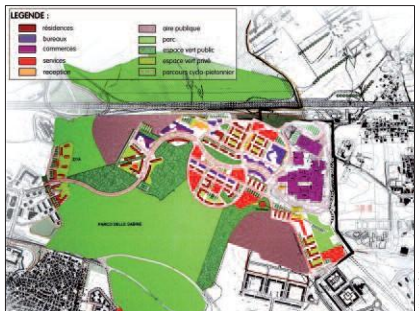
Plan de la centralité métropolitaine de Bufalotta.

En confirmant la forme prescriptive du Plan régulateur, la loi de 1942 établit que les droits à bâtir acquis par le secteur privé dans le cadre d'un PRG sont toujours en vigueur dans les Plans successifs.