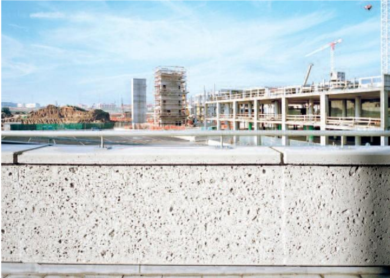
Massimo Singuina / Contrasto-REA