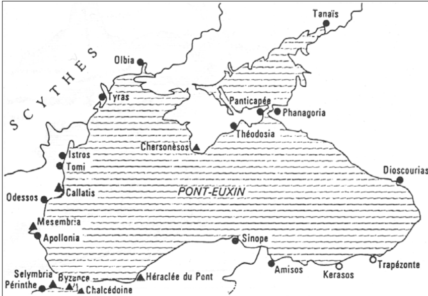
Fig. 1. Carte générale de situation d'après Dubois 1996).

Kerch et celle de Taman' (Russie actuelle) et son influence s'étend au III e s. a.C. jusqu'à l'embouchure du Don au nord-est où se trouve la cité de Tanaïs.