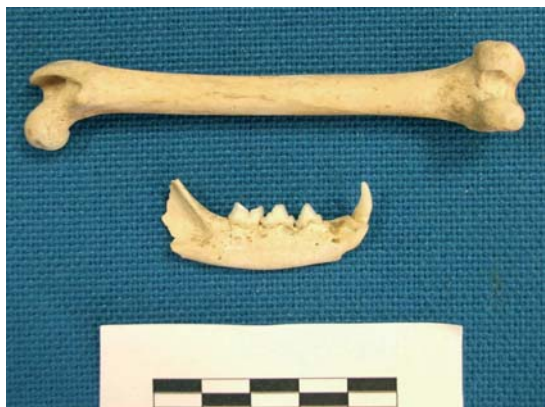
FIGURE 9 : Fémur et mandibule de chat.