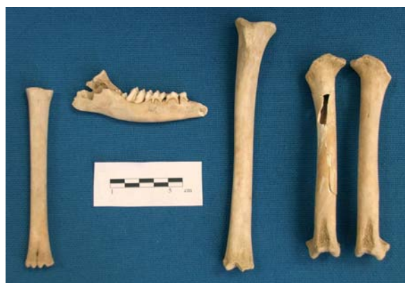
FIGURE 11 : Éléments du squelette du jeune chevreuil.