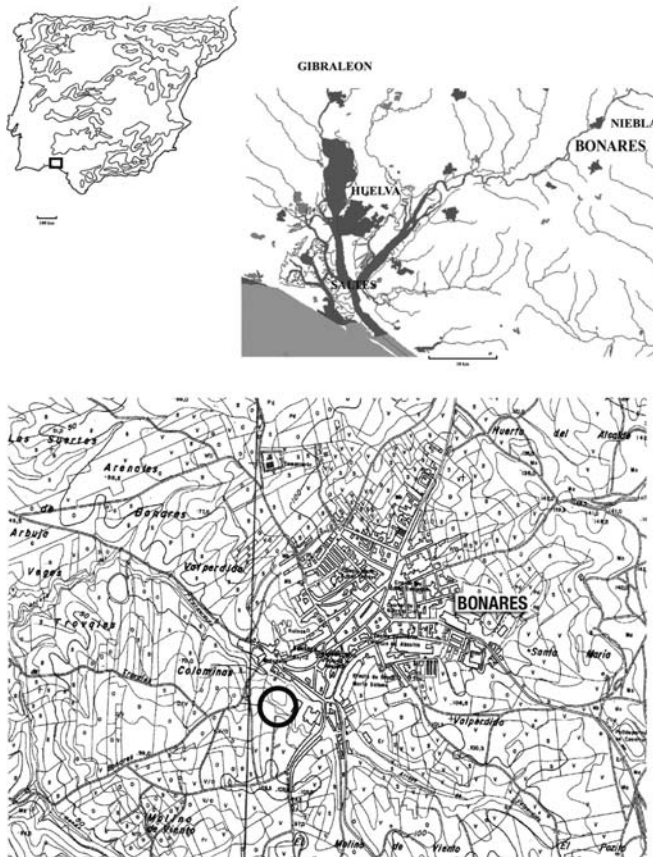
FIGURE 1 : Situation géographique du site archéologique de La Barrera (commune de Bonares, province de Huelva, Espagne).

En 2001, un projet d'urbanisation concernant une grande partie de la superficie occupée par ce site islamique est réalisé. Il a permis de mettre au jour quelques structures en forme de silos et d'effectuer un suivi archéologique, permettant notamment la découverte de l'ensemble des ossements étudiés dans cet article. La récupération de ce matériel n'a pas été faite de manière systématique, car elle était conditionnée par le travail des pelleteuses qui réalisaient le terrassement. D'autres silos étaient visibles sur le site mais les archéologues n'ont pu y prélever ni os ni céramique. Malgré ces conditions peu favorables, il paraissait intéressant d'étudier ce dépôt, car il existe peu d'études archéozoologiques pour les sites de cette période et qu'il s'agit de la première référence à la faune de cette époque pour la province de Huelva.