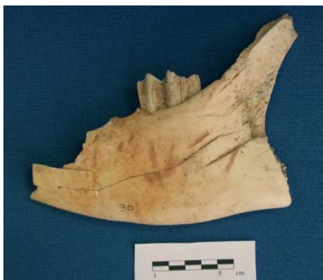
FIGURE 5 : Traces de découpe sur une mandibule de bœuf (face médiale).