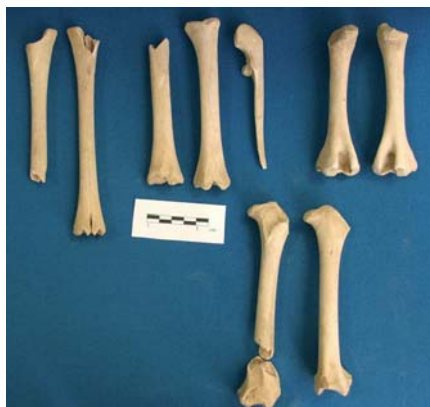
FIGURE 10 : Vestiges osseux du squelette postcrânien d'un très jeune cerf.