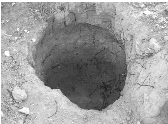
FIGURE 2 : Photographie du silo étudié (diamètre d'ouverture = 1m).

En 2001, un projet d'urbanisation concernant une grande partie de la superficie occupée par ce site islamique est réalisé. Il a permis de mettre au jour quelques structures en forme de silos et d'effectuer un suivi archéologique, permettant notamment la découverte de l'ensemble des ossements étudiés dans cet article. La récupération de ce matériel n'a pas été faite de manière systématique, car elle était conditionnée par le travail des pelleteuses qui réalisaient le terrassement. D'autres silos étaient visibles sur le site mais les archéologues n'ont pu y prélever ni os ni céramique. Malgré ces conditions peu favorables, il paraissait intéressant d'étudier ce dépôt, car il existe peu d'études archéozoologiques pour les sites de cette période et qu'il s'agit de la première référence à la faune de cette époque pour la province de Huelva.