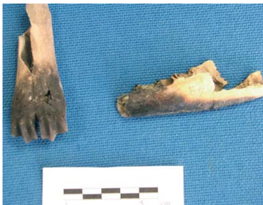
FIGURE 7 : Métacarpe et mandibule de caprinés présentant des traces de brûlures.