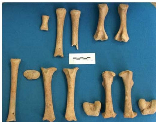
FIGURE 8 : Restes osseux de squelette postcrânien de fœtus d'équidé.