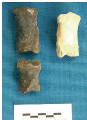
FIGURE 6 : Phalanges de bœuf (passées au feu pour les deux de gauche).