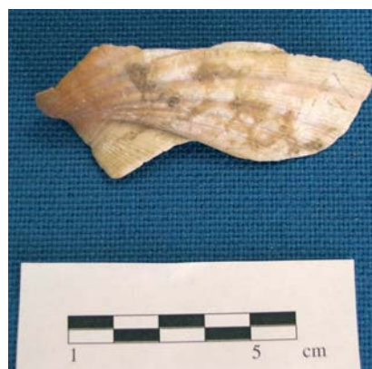
FIGURE 12 : Fragment de valve droite de coquille Saint-Jacques.