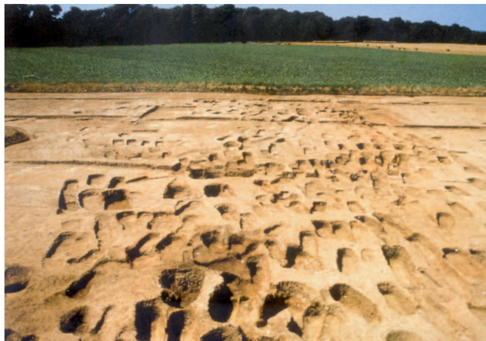
Nécropole mérovingienne de Conchil-le-Temple (Pas-de-Calais). Cliché Y. Desfossés. D'après La France archéologique, 20 ans d'aménagements et de découvertes , Hazan, Paris, 2004, p. 168.

1. Fonds de cabane : on devrait préférer l'expression « structures semi-excavées », plus neutre. Bâties en terre et bois et le plus souvent associées à des maisons construites au niveau du sol, elles présentent une excavation peu profonde du sol entre les poteaux qui soutiennent la toiture. Leur fonction est le plus souvent celle d'annexes pour diverses activités domestiques (filage, tissage) ou artisanales.