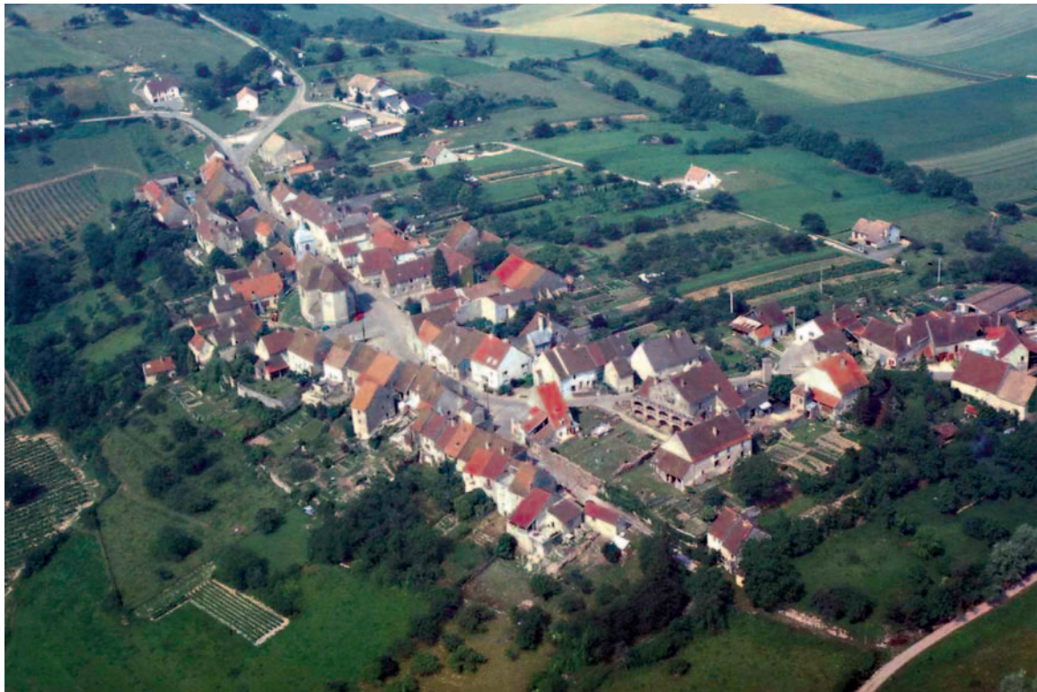
Le village d'Offlanges (Jura).

Postdoctorante en archéogéographie, université de Coimbra-Porto (Portugal), CEAUCP/FCT, UMR 7041 ArScAn, équipe « Archéologies environnementales »